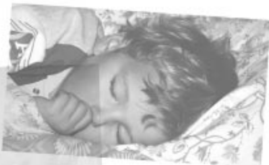
[2] For uddybning, se Krigens barn af Lars Gustafsson, Kommuneforlaget 1989.

Tolkens forklaring på det manglende fremmøde var dels, at der i børnenes hjemland Irak ingen tradition er for forældremøder, dels at det er et problem at få mindre børn passet. Desuden ville mødet kollideres med familiens aftensmåltid. Hvis vi havde valgt at invitere hele familien og for eksempel havde bedt dem om at tage en ret med fra hver familie, ville de med større sandsynlighed være kommet. Dette ville dog blive et meget stort arrangement, som ikke gav os den mulighed for formidling omkring vores arbejde med børnene, som vi havde forudsat. Som en konsekvens af dette valgte vi ikke at holde det andet møde med forældrene, men i stedet at intensivere samarbejdet med børnenes skoler. I forbindelse med afslutningen af de to grupper besluttede vi desuden at gennemføre individuelle opfølgningssamtaler med forældre til enkelte af børnene.